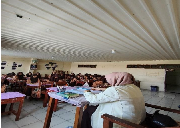
Siswa kelas VIII.B Sedang Melaksanakan Pretest