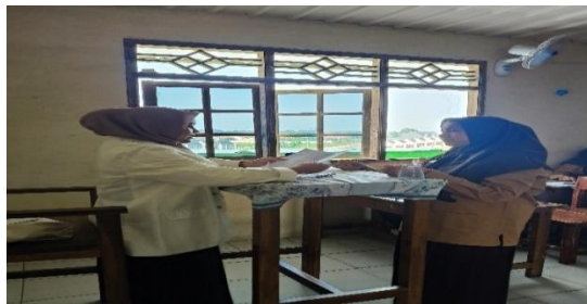
Foto Bersama waka kurikulum SMP IT