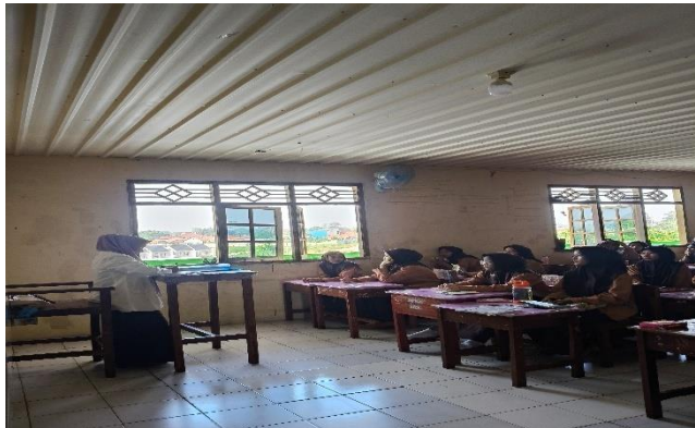
Pelaksanaan Pembelajaran Di Kelas Eksperimen