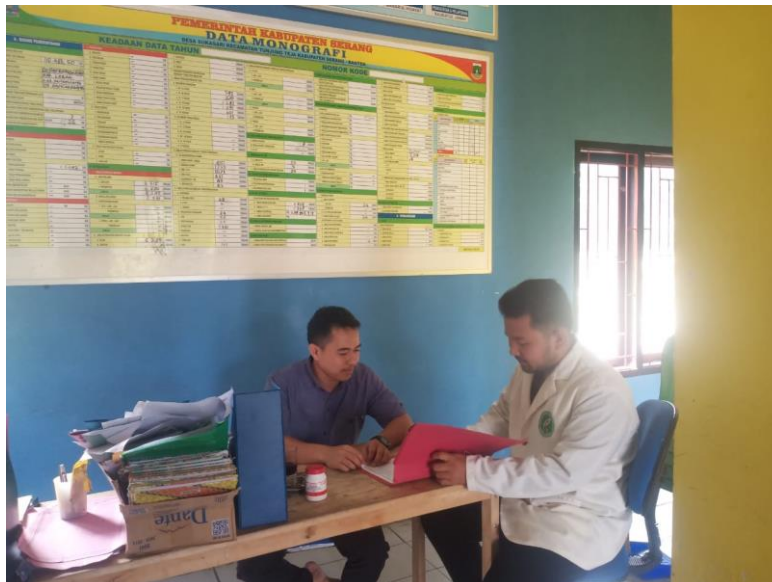
Gambar (Wawancara dengan ketua LPM Desa Sukasari)