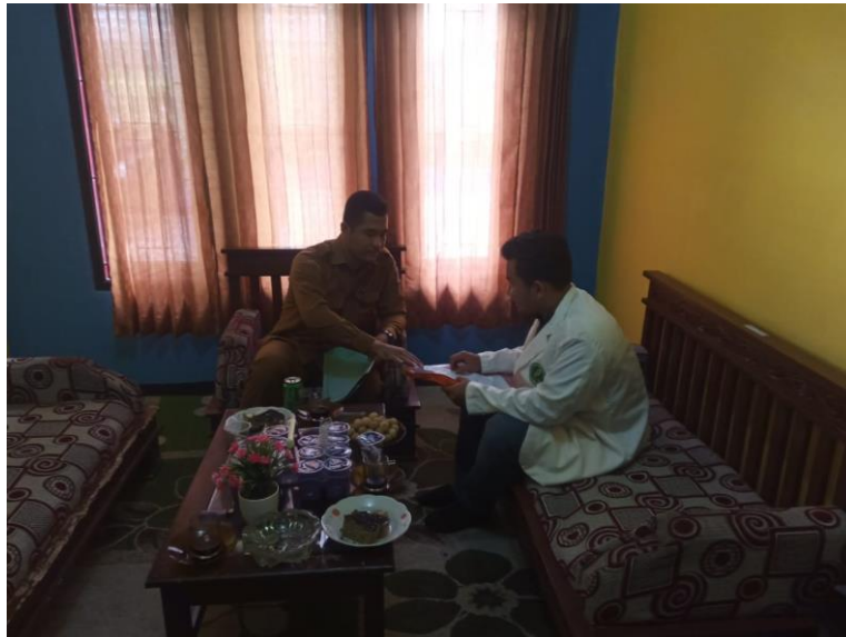
Gambar (Wawancara dengan Kepala Desa Sukasari)