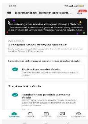
Gambar 4.10 Pemasaran Produk Melalui Media Sosial Tiktok Shop 75

dapat meningkatkan kesadaran masyarakat dan meningkatkan penjualan produk. Masyarakat juga dapat membangun hubungan yang lebih dekat dengan pelanggan dan meningkatkan loyalitas masyarakat dalam jangka panjang, program daur ulang sampah melalui pemasaran tersebut, dapat meningkatkan pendapatan masyarakat dan memperluas melalui Shopee.