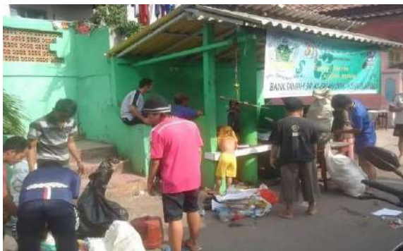
Gambar 4.1 Kegiatan Bank Sampah Di Desa Sumuranja 63

Anggota kreativitas sumuranja telah membuat kegiatan bank sampah yang inovatif dan efektif untuk mengelola sampah di Desa Sumuranja dengan dibantu oleh masyarakat setempat kegiatan ini telah menjadi contoh bagi desa-desa lain dalam mengelola sampah dengan baik dan benar. Bank sampah ini tidak hanya membantu mengurangi jumlah sampah yang ada di lingkungan, tetapi juga meningkatkan kesadaran masyarakat tentang pentingnya mengelola sampah dengan baik dan benar. anggota kreativitas sumuranja telah bekerja keras untuk mengedukasi masyarakat tentang cara memilah sampah dan menggunakannya sebagai sumber daya yang berharga.