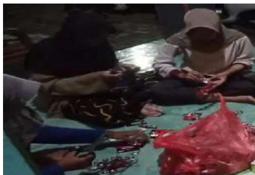
Gambar 4. 3 Menggunting sampah plastik 65

Pada proses ini anggota kelompok menggunting sampah plastik sesuai ukuran, kemudian sampah plastik dilipat sesuai pola yang diinginkan. Kemudian sampah plastik dibentuk sehingga menjadi produk yang memiliki nilai jual. Lalu ulangi menggunting sampah plastik hingga banyak dan sesuai dengan apa yang akan di buat kerajinan.