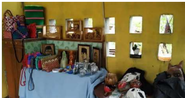
Gambar 4.11 Pemasaran Produk Secara offline 76

Gambar di atas merupakan bentuk pemasaran secara langsung melalui pameran, memamerkannya di acara pameran UMKM Desa Sumuranja. Selain melakukan pameran, anggota juga menawarkannya melalui pertemuan dengan pembeli di tempat yang telah disepakati.