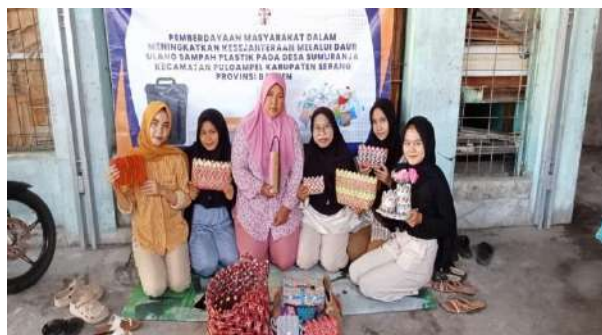
Gambar 4.6 hasil kerajinan sampah plastik 68

Pada gambar di atas menunjukkan bahwa anggota melakukan tahap selanjutnya tahap akhir dari kerajinan tersebut. Tahap ini digunakan untuk hasil akhir sehingga menjadi sebuah produk yang memiliki nilai jual. Alat yang digunakan adalah benang, jarum benang, gunting dan resleting.