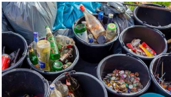
Gambar 4.2 Kegiatan memilah sampah 64

Setelah kegiatan bank sampah, langkah selanjutnya adalah memilah sampah. Anggota Kreativitas Sumuranja dan masyarakat Desa Sumuranja bekerja sama untuk memilah sampah menjadi beberapa kategori, seperti sampah organik, sampah plastik, sampah kertas, dan lain-lain.