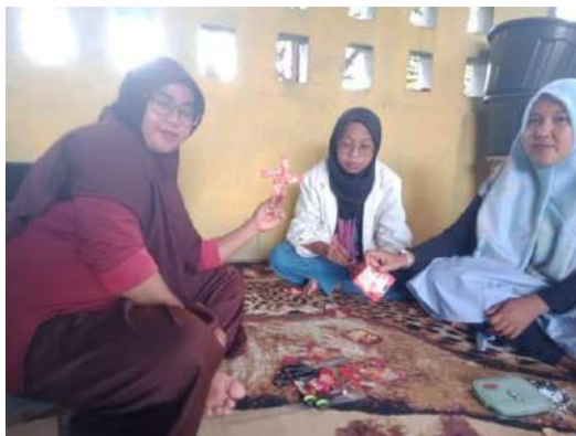
Gambar 4. 4 Merakit dan menganyam hasil potongan sampah plastik 66

Dalam gambar 4.4 menunjukkan bahwa ketua dan wakil ketua kelompok kreativitas sumuranja beserta peneliti melakukan merakit menganyam hasil potongan sampah plastik pada proses ini anggota dan peneliti anggota melanjutkan langkah sebelumnya yaitu merakit potongan sampah plastik yang telah dibuat sehingga menghasilkan