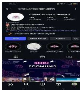
Gambar 4.8 Pemasaran Produk Melalui Media Sosial Instagram 73

Dengan menggunakan whatsaap business sebagai platform pemasaran, tersebut dapat meningkatkan kesadaran masyarakat dan meningkatkan penjualan produk. Masyarakat juga dapat membangun hubungan yang lebih dekat dengan pelanggan dan meningkatkan loyalitas masyarakat dalam jangka panjang, program daur ulang sampah mrlalui pemasaran tersebut