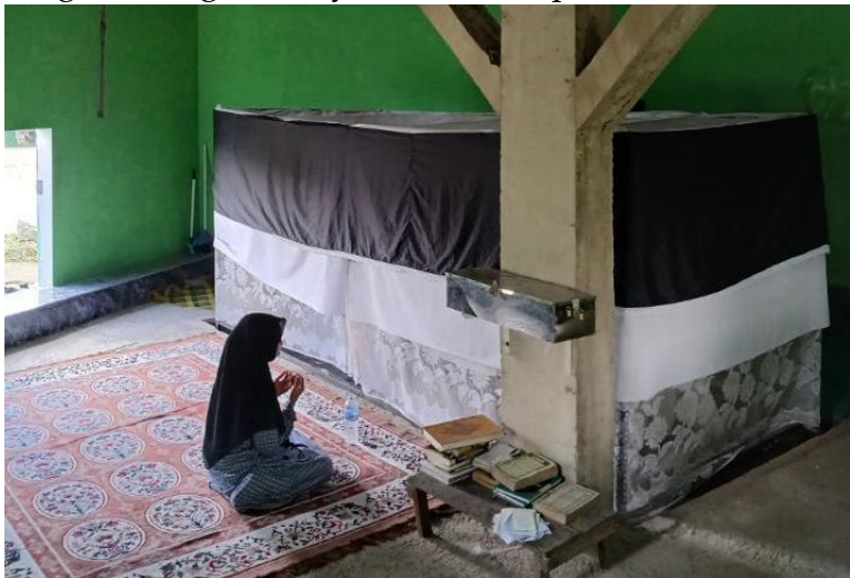
Gambar SEQ Gambar \* ARABIC 1 Makam Ki Buyut

Sampai saat ini, tidak ada satu pun versi pasti yang secara umum diterima mengenai siapa sesungguhnya sosok Buyut Ireng. Cerita tentangnya berkembang dalam beragam versi, dan masing-masing diyakini sebagai bagian dari kebenaran sejarah oleh berbagai kalangan masyarakat setempat.