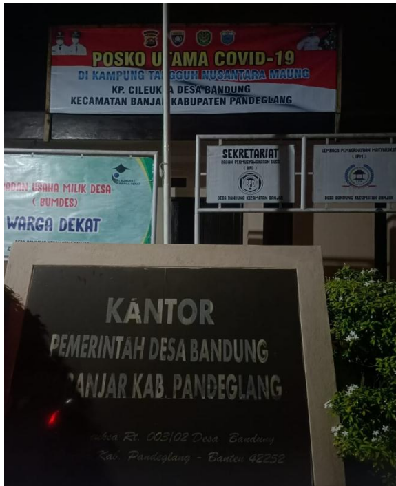
Kantor Desa Bandung Kecamatan Banjar