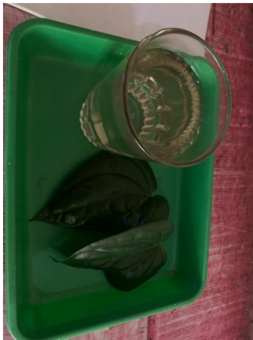
Sajian yang wajib ada pada saat pelaksanaa Tradisi Maca Syekh