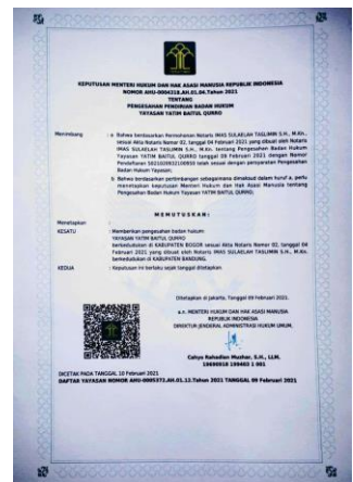
Lembar Pengesahan Yayasan Istana Baitul Qurro