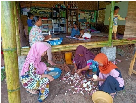
Proses Pengupasan Kulit Singkong Untuk Dijadikan Keripik Singkong