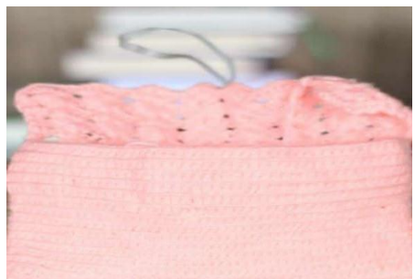
Tas Hasil Pelatihan Merajut