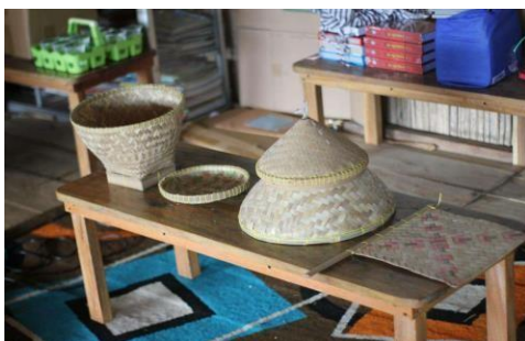
Anyaman Bambu Hasil Kerajinan Tangan