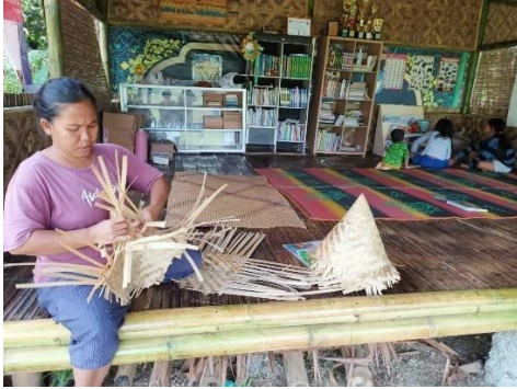
Kerajinan Tangan Anyaman Bambu oleh Ibu-ibu dhuafa