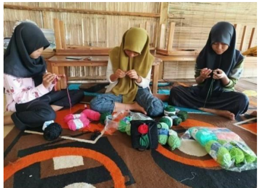
Pelatihan Merajut Oleh Yatim-Piatu Remaja