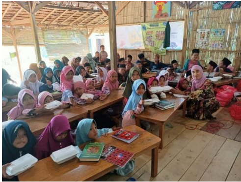
Kegiatan Santunan Jumat Berkah