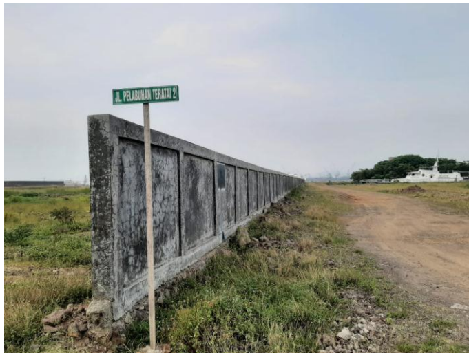
Reklamasi di Desa Margagiri