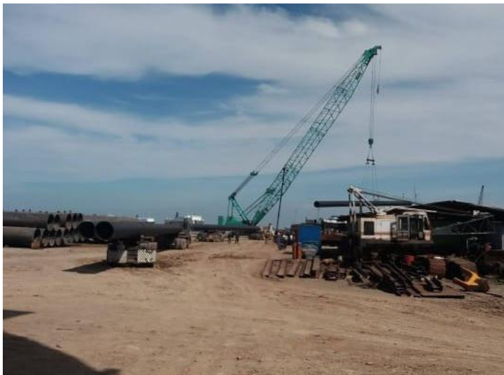
Industri di Kawasan Reklamasi