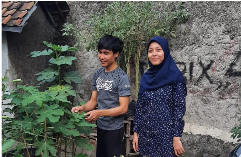
Wawancara dengan Masyarakat Desa Margagiri