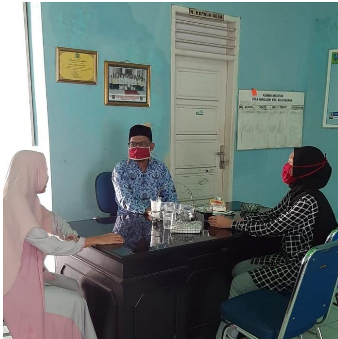
Wawancara dengan Perangkat Desa