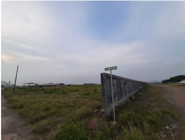
Lahan Reklamasi di Desa Margagiri