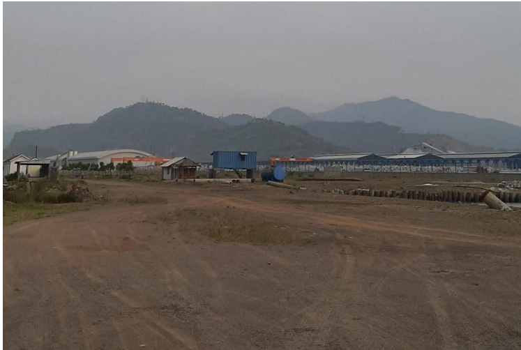
Reklamasi di Desa Margagiri