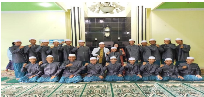
Foto Abi dan Umi Pengasuh PPQ. Ath-Thabraniyyah bersama para Peserta Khataman Al-Qur'an Wisuda bacaan Qira'at

Berikut gambar kegiatan pengajian penerapan bacaan Qira'at Sab'ah terhadap Al-Qur'an yang juga tidak hanya diikuti oleh santri melainkan dari para ulama yang ingin belajar mengenai Qira'at Sab'ah.