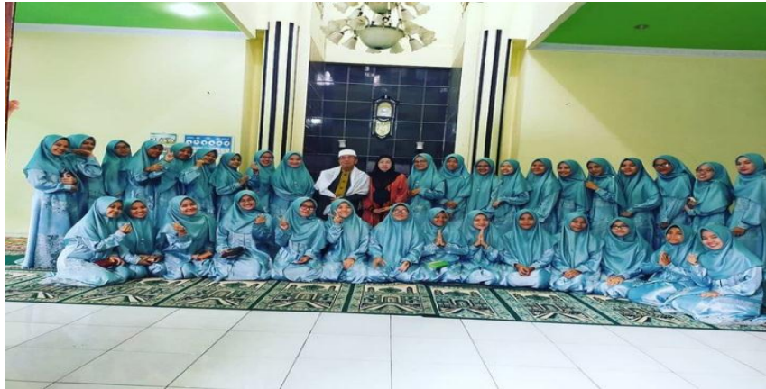
Foto Abi dan Umi Pengasuh PPQ. Ath-Thabraniyyah bersama para Peserta Khataman Al-Qur'an Wisuda bacaan Qira'at Hafs dan Qira'at Sab'ah 2020, yang diikuti oleh 34 peserta yang terdiri dari Santriwati PPQ. Ath-Thabraniyyah.

Hafs dan Qira'at Sab'ah 2020, yang diikuti oleh 20 peserta yang terdiri dari Santriwan PPQ. Ath-Thabraniyyah.