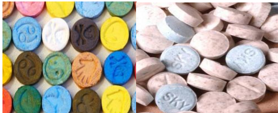
(gambar MDMA atau ekstasi) https://www.merdeka.com/teknologi/apa-itu-mdma-jenis-ekstasi-di-rumah-raffi.html

MDMA ( Methylene Dioxy Meth Amphetamine ) atau ekstasi memiliki pengaruh seperti Amphetamine dan Halusinogen . Ekstasi biasanya berbentuk tablet atau kapsul berwarna dengan desain yang berbeda-beda. Nama lain dari ekstasi adalah Dolphin , Black Heart , Gober , Circle K .