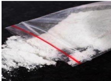
(gambar sabu-sabu) https://www.tribunnewswiki.com/2019/07/22/sabu-sabu

Cara pemakaiannya di hirup asapnya melalui pembakaran. Asap sabu-sabu masuk ketubuh melalui hidung, lalu ketenggorokan, paru-paru, jantung dan ke otak. Sabu-sabu mempengaruhi sistem saraf pusat dan menyebabkan paranoid (rasa takut berlebihan), menjadi sangat sensitif (mudah tersinggung), dan halusinasi visual/ pengguna sabu cenderung memakai dalam jumlah banyak dan sukar berhenti sekalipun badannya makin sakit.