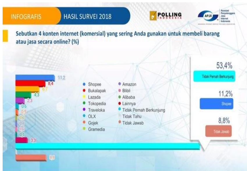
Gambar 2 Daftar Website Ecommerce Yang Sering Di gunakan

pengguna internet di Indonesia sangat besar saat ini, dan sudah banyak kalangan millennial yang terbiasa berbelanja secara online. Hanya melalui smart phone mereka bisa berselancar mencari barang yang di inginkan tanpa perlu bepergian dan berdesak-desakan berikut beberapa website yang sering di kunjungi masyarakat millennial untuk melakukan pembelian secara online.