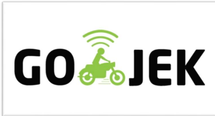
Gambar 1.1 Logo Gojek Lama

Gojek memperkuat posisi sebagai platform teknologi terdepan di Asia Tenggara kebanggaan anak bangsa melalui pergantian logo ( rebranding ). Perubahan logo ini merupakan tonggak sejarah baru yang menandai evolusi Gojek dari layanan ride-hailing , menjadi sebuah ekosistem terintegrasi yang menggerakkan orang, barang, dan uang. Logo Gojek dapat dilihat dari gambar di bawah ni :