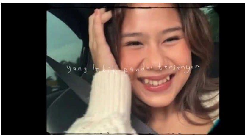
Gambar 3.1 Foto: Cermin/youtube.com/nadinamizah/

ku berjalan lebih jauh di dunia," 2 tuturnya dalam salah satu unggahan Instastory Nadin Amizah pada 28 Januari 2021.