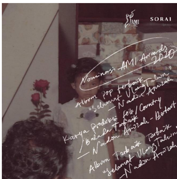
Gambar 3.3 Foto: Nomine AMI Awards 2020/Instagram.com/nadinamizah/

Nadin menggunakan suaranya yang lembut sebagai fasad, yang dapat menyengat penonton bersama lirik yang menggugah emosi karena kejujurannya. Dalam hidup, manusia dapat merasakan kecemasan tentang keluarga, cinta dan persahabatan. Album populer terbaik menyajikan keunikan dalam makna sekaligus menjadi penghibur hari yang lara. Nadin mampu mencapai titik keseimbangan melalui albumnya dan sebagai perwakilan yang sangat amat jujur dari generasi musisinya. 17