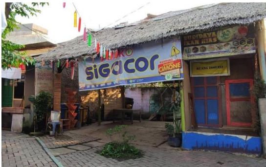
Saung Kp. Inovasi Cimone