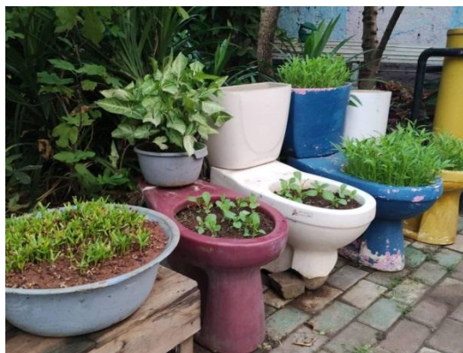
Barang bekas menjadi media tanam