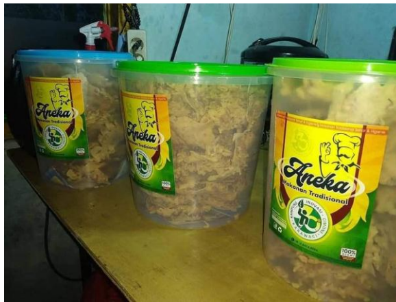
Peyek buatan warga Kampung Inovasi Cimone