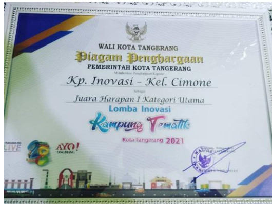
Piagam lomba Inovasi Kampung Tematik