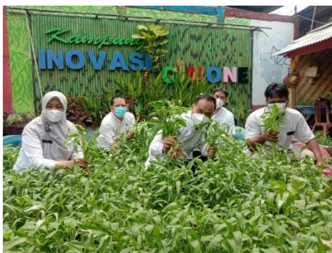
Panen bersama DLHK & camat karawaci