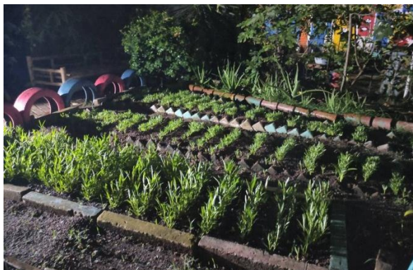
Kebun/lahan pertanian Kp. Inovasi Cimone