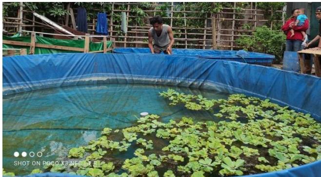
Kolam budidaya ikan