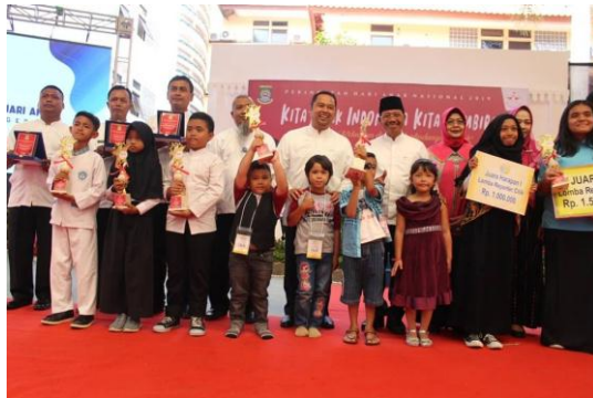
Penghargaan Kampung Ramah Anak