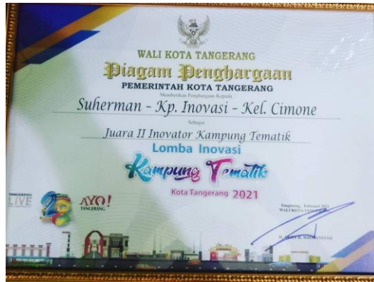
Piagam juara 2 Lomba Inovator Kampung Tematik