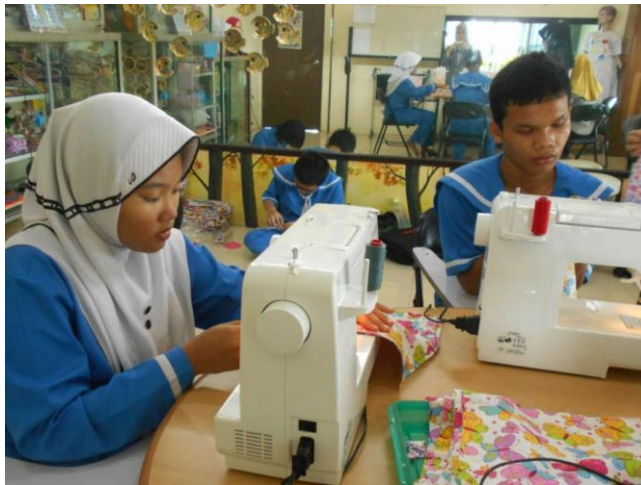
Foto salah satu penyandang disabilitas sedang melakukan kegiatan vokasional