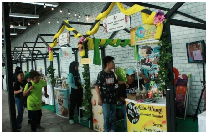
Foto kegiatan acara pameran The 8 th organic, Green & Healthy Expo of Indonesia.