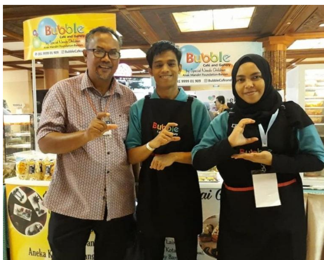
Foto kegiatan acara pameran Step together