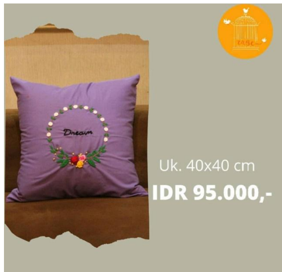
Foto harga sarung bantal sulam