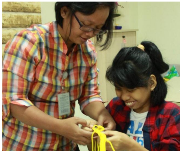
Foto salah satu penyandang disabilitas sedang melakukan kegiatan vokasional