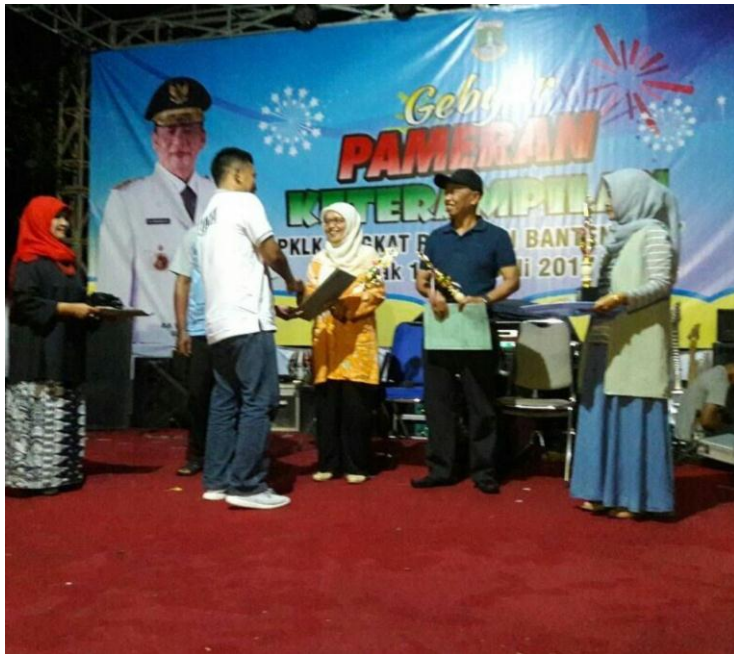
Foto kompetisi Gebyar PKLK tingkat Provinsi Banten Tahun 2017