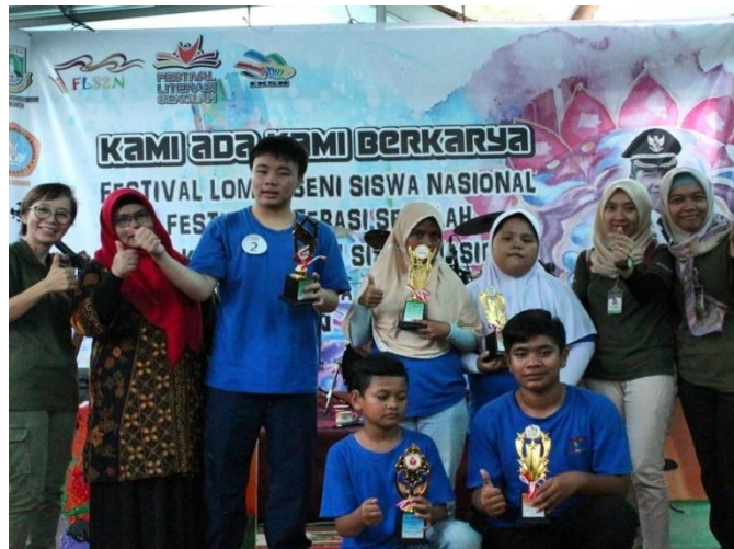
Foto prestasi kegiatan lomba tingkat Kota Serang (LKSN, Literasi, dan FLS2N) Tahun 2020