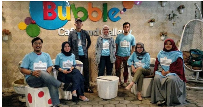
Foto kunjungan dari komunitas Kibanten