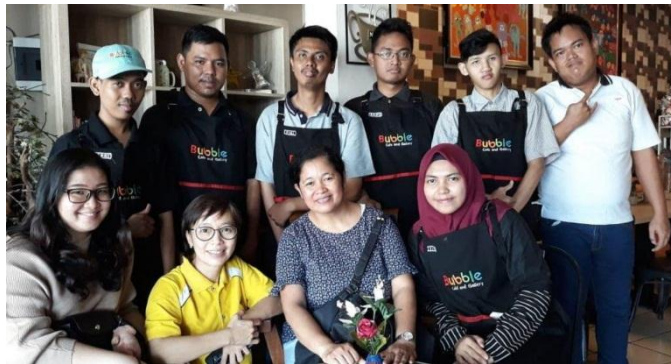
Foto bersama kunjungan dari komunitas Green and Yellow