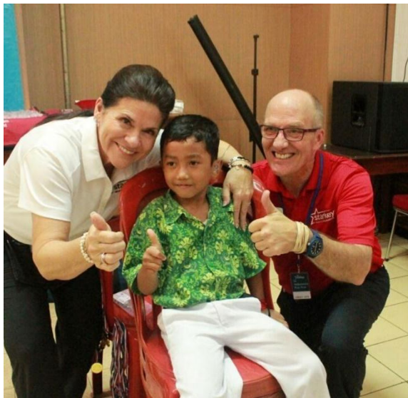
Pemberian alat bantu untuk anak-anak berkebutuhan khusus oleh PT. ABDI