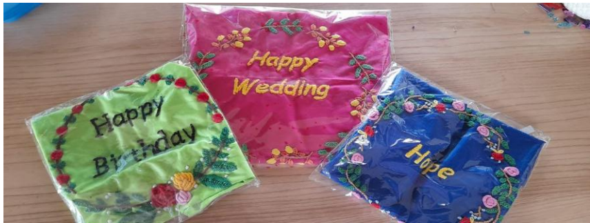
Hasil dari kegiatan vokasional yaitu ketrampilan sarung bantal