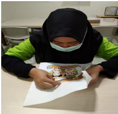
Foto penyandang disabilitas yang sedang melakukan kegiatan vokasional