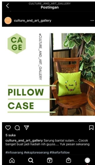
Foto hasil kegiatan vokasional yaitu sarung bantal sulam yang di promosikan melalui media sosial