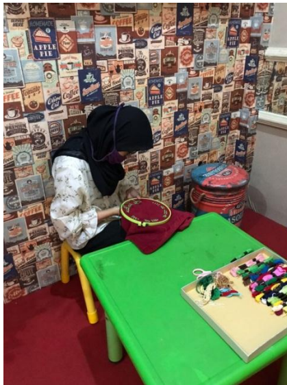
Foto penyandang disabilitas yang sedang melakukan kegiatan vokasional