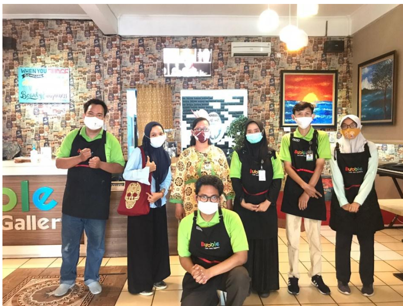
Foto bersama para penyandang disabilitas di Café Bubble and Gallery