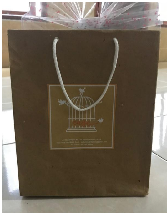
Hasil dari kegiatan vokasional yang siap diproduksi