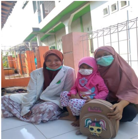
FOTO BERSAMA ORANG TUA