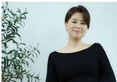
Gambar 3.6 Jang Hye Jin Pemeran Kim Chung-sook

Jang Hye-jin lahir 5 September 1975 dan semakin terkenal di dunia internasional karena perannya sebagai Kim Chung-sook dalam film Parasite . Jang Hye-jin, istri Kang-ho dalam Parasite , juga sudah bermain film di Korea Selatan sejak 1997.