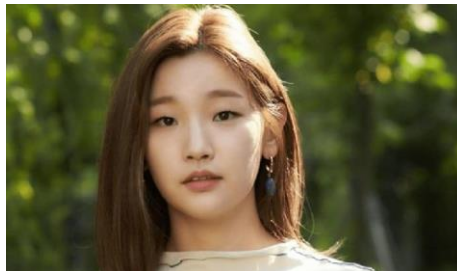
Gambar 3.5 Park Sodam Pemeran Kim Ki-jung

kyun-pemeran-parasite-berjudul-the-voice?page=all, diakses pada 9 Juni pukul 09.58 WIB