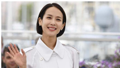
Gambar 3.7 Cho Yeo-jeong Pemeran Yeon Kyo

Cho Yeo Jeong lahir di Seoul, Korea Selatan, 10 Februari 1981. Pemeran nyonya kaya istri Tuan Park Dong Ik di film Parasite ini ternyata sangat berbakat. Ia kerap menyabet penghargaan. Pada 2010, ia menjadi Most Popular Stars dalam Blue Dragon Film Awards melalui film The Servant. Ia juga menjadi Best Supporting Actress dalam Korean Association of Film Critics Awards 2014 melalui Obsessed. 9