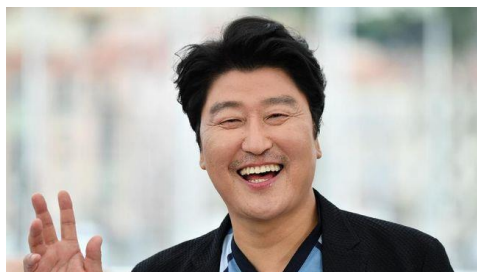
Gambar 3.2 Song Kang Ho Pemeran Kim Ki-taek

Lahir di Provinsi Gyeongsang pada 17 Januari 1967, Song Kang-ho tidak pernah mengenyam pendidikan formal untuk menjadi aktor. Setelah lulus SMA, ia bergabung dengan