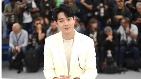
Gambar 3.4 Choi Woo-shik Pemeran Kim Ki-woo

Choi Woo Shik lahir di Seoul pada 26 Maret 1990. Lalu tahun 2001, di usia 11 tahun, keluarganya imigrasi ke Kanada. Di tahun 2014 Woo Shik membintangi film Set Me Free dan mendapatkan penghargaan pertamanya sebagai Actor of the Year di ajang Busan International Film Festival Ke-19 tahun yang sama. Tak hanya itu, di berbagai penghargaan lain dia juga dapat piala untuk kategori Best New Actor dan Popular Actor Award . 6