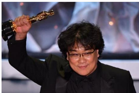
Gambar 3.1 Bong Joon-ho Sutradara Parasite

Bong Joon Ho lahir di Daegu, Korea Selatan pada 14 September 1969. Ia mewarisi kemampuan seni dari keluarganya. Ayahnya merupakan seorang perancang grafis awal dan kakek dari pihak ibunya merupakan novelis terkenal Park Tae-won, yang menulis karya terkenal seperti A Day In The Life of Kubo The Novelist . Saat Bong berusia 15 tahun, ia ingin menjadi pembuat film. Bong Joon Ho menyelesaikan pendidikan tingginya di Universitas Yonsei, jurusan Sosiologi. Semasa