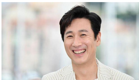
Gambar 3.3 Lee Sun Kyun Pemeran Park Dong-ik

Pria kelahiran 2 Maret 1975 ini memulai kariernya lewat teater musikal The Rocky Horror Show . Setelah itu, namanya kemudian melejit karena memiliki suara yang khas dia dan para penggemarnya kemudian memberinya julukan The Voice . Lee Sun Kyun semakin populer ketika ia berperan dalam drama Taerung National Village (2005) yang di sutradarai oleh Lee Yoon Jung. Drama ini kemudian mengantarkannya untuk menjadi pemeran pendukung utama dalam drama Coffee Prince . Sukses berperan membuat namanya kian melejit di dunia perfilman Korea Selatan. 5