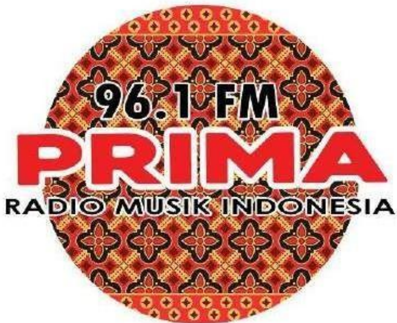
Gambar 3.1 Logo Radio 96,1 Prima FM