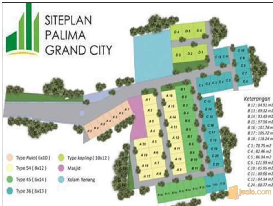
Gambar 3.2. Letak Geografis Perumahan Palima Grand City