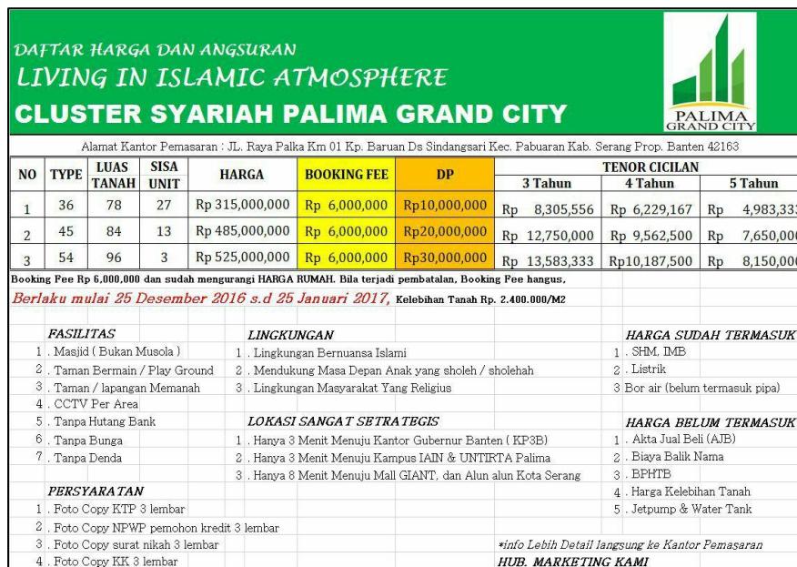
Table 4.1. Daftar Harga dan Angsuran Rumah