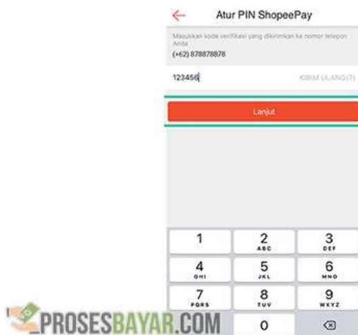
Gambar 3.3 Form Masukkan