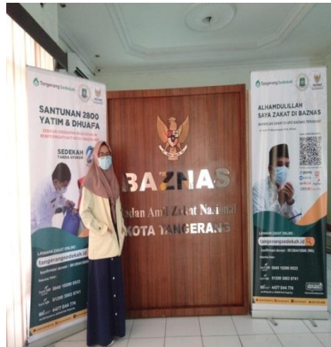
KANTOR BAZNAS KOTA TANGERANG (23 MARET 2021)