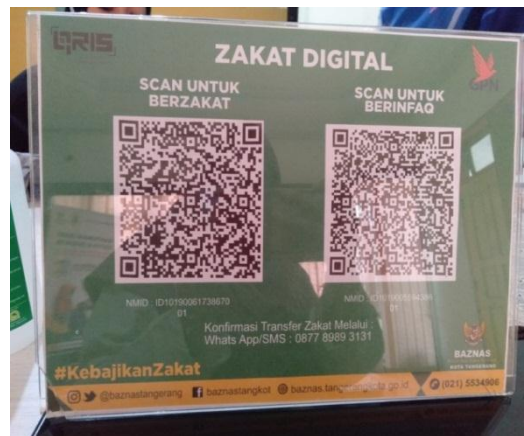
Konten Ajakan Berzakat Baznas Kota Tangerang