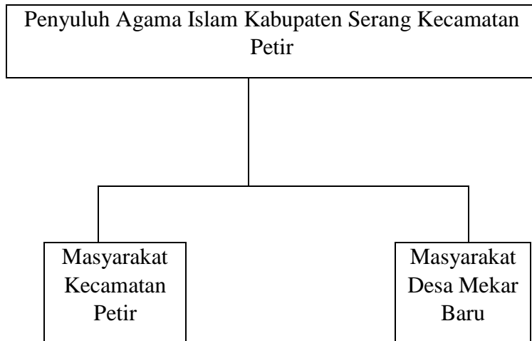
Tabel 3.3 Sasaran Penyuluh Agama Islam Kecamatan Petir Tahun 2021

Dalam konteksnya dengan Agama Islam, Penyuluhan Agama Islam diartikan usaha penyampaian ajaran Islam kepada umat manusia oleh seseorang atau kelompok orang secara sadar dan terencana, dengan berbagai metode yang baik dan sesuai dengan kondisi sasaran penyuluhan, sehingga berubahlah keadaan umat itu kepada yang lebih baik, untuk memperoleh kebahagiaan di dunia dan di akhirat. Hasil akhir yang