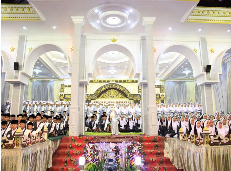
GEDUNG SMU TAKHASSUS AL-QUR'AN

Salah satu kegiatan Haflah Khotmil Qur'an Ponpes Al-Asy'ariyyah yang di selenggarakan tahunan Setiap tanggal 10 Muharrom