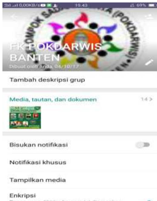
Gambar 6 Grup Whatsapp Pokdarwis Banten