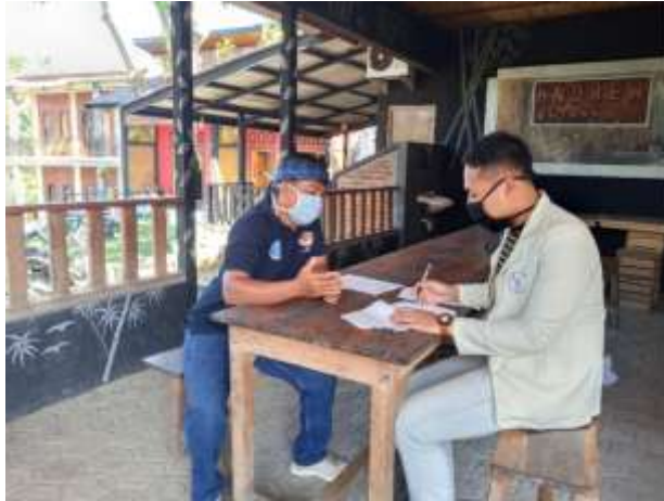
Gambar 3 Wawancara dengan Ketua Pokdarwis di Lebak