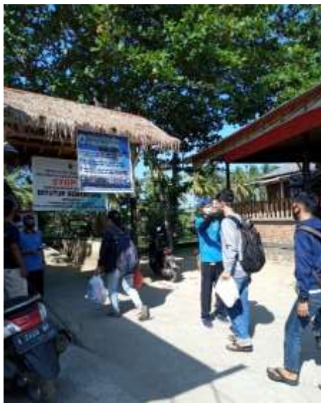
Gambar 2 Observasi Kegiatan Pokdarwis Banten di Destinasi wisata Pantai Sawarna