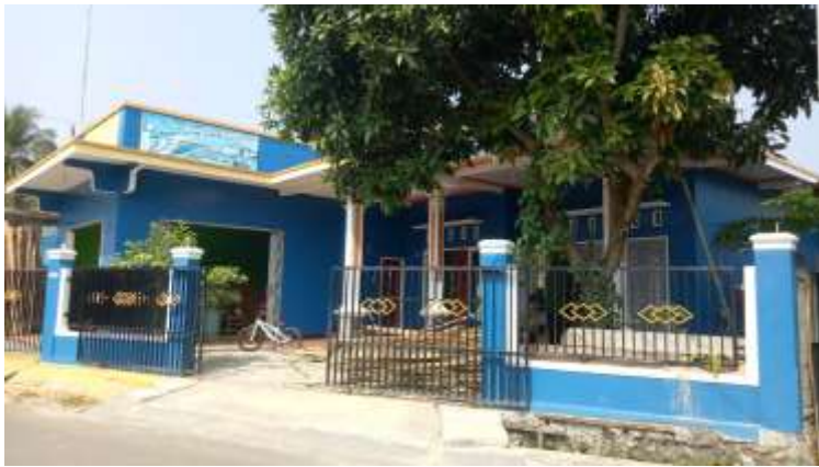
Gambar 1 Kantor Pokdarwis Banten