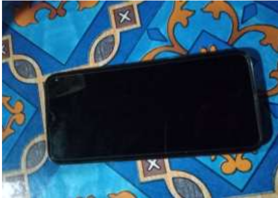
Gambar 5 Media yang digunakan untuk berkomunikasi