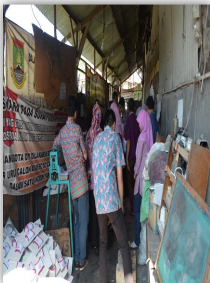
Kunjungan Dari Untirta Untuk Memberi Program Pelatihan