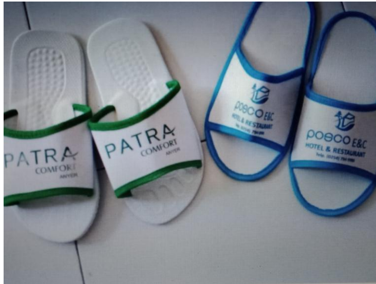
Produksi Sandal Hotel IKM Permata