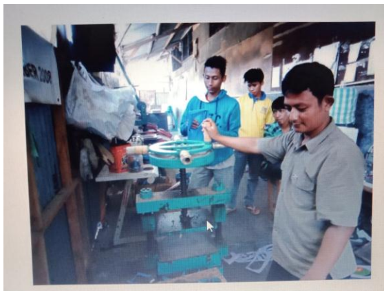
Alat Pemotongan Bahan Baku Sandal Hotel Ikm Permata