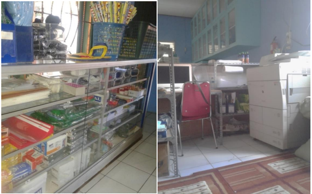
Usaha percetakan KOMILA SMART: penjualan alat tulis fotocopy