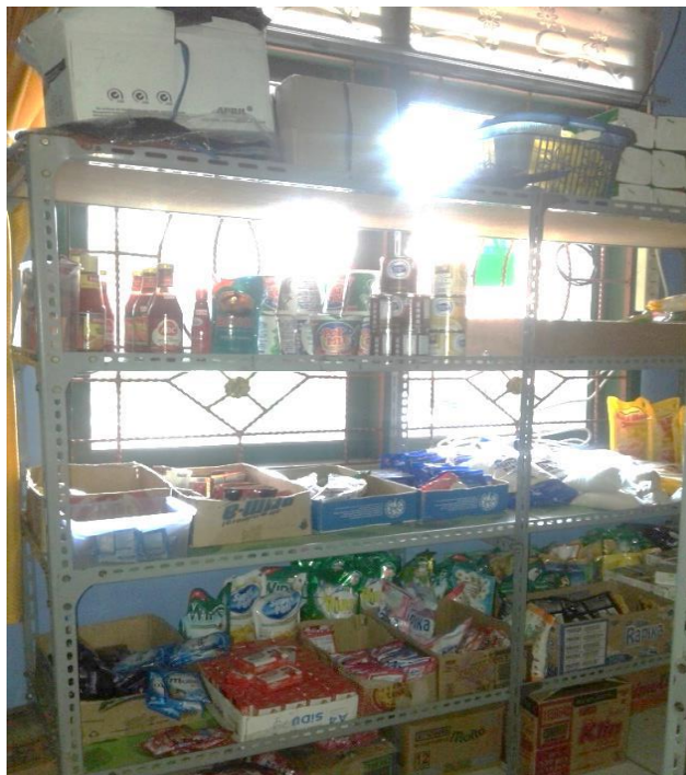
Usaha WASERDA(warung serba ada) KOMILA SMART