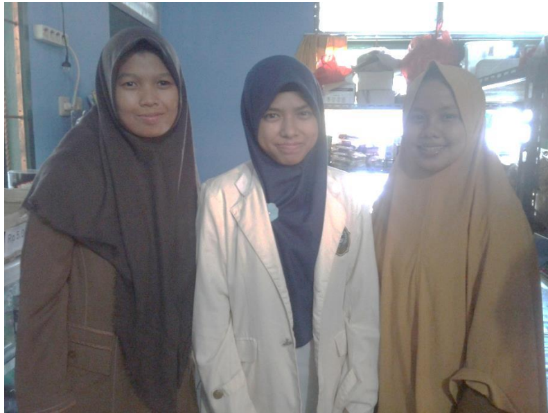
Foto bersama Penulis dengan Karyawan KOMILA SMART