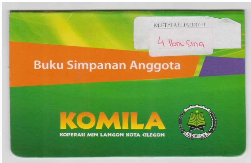
Tabungan siswa KOMILA SMART