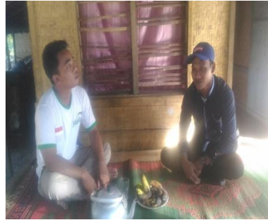
MONEV DAN RTL BERSAMA MASYARAKATA