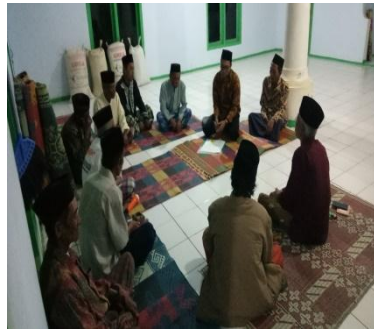
MONEV DAN BERSAMA MASYARAKAT