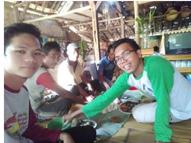
SILATURAHMI GUNA MENDEKATKAN DENGAN MASYARAKAT JALAN YANG HARUS