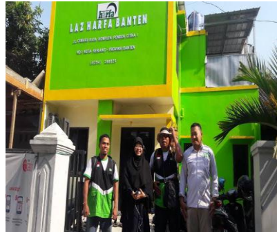
KANTOR LAZ-HARFA BANTEN