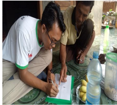
WAWANCARA BERSAMA FIELD FACILITATOR DAN MASYARAKAT TERJUN LAPANGAN DENGAN FF DAN MONEV