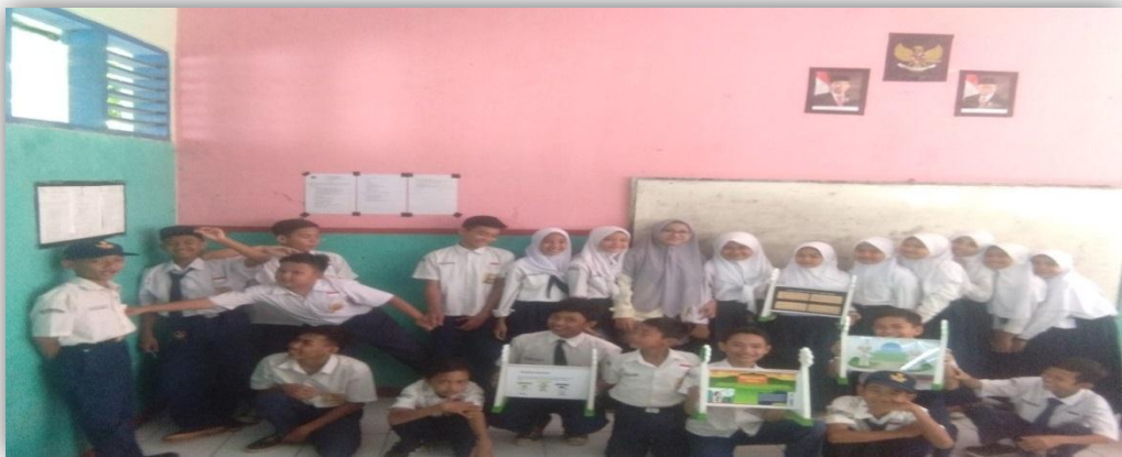
Lampiran 3 Surat Menyurat, Angket Dan Hasilnya