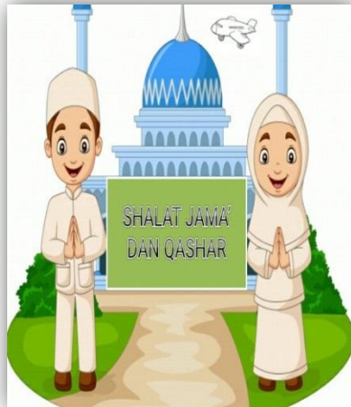
Gambar 1. Flip chart Setelah Revisi (Penyempurnaan)