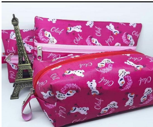
Produk Perempuan Binaan (Menjahit) : Tempat Tissue dan Tempat Makeup