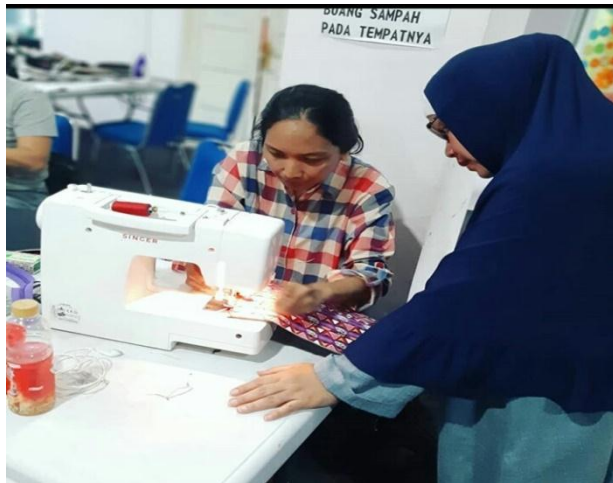
Pelatihan Menjahit Membuat Pouch