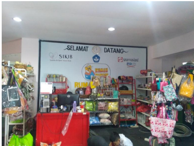
Kios Rumah Pintar BSD