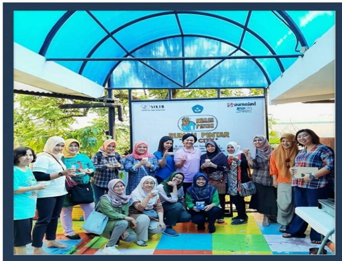
Pelatihan Membuat Sabun Dari Minyak Bekas