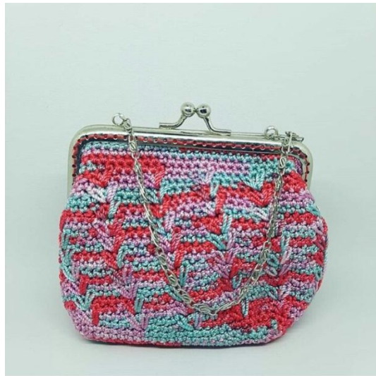
Produk Hasil Perempuan Binaan (Merajut) : Tas Kecil