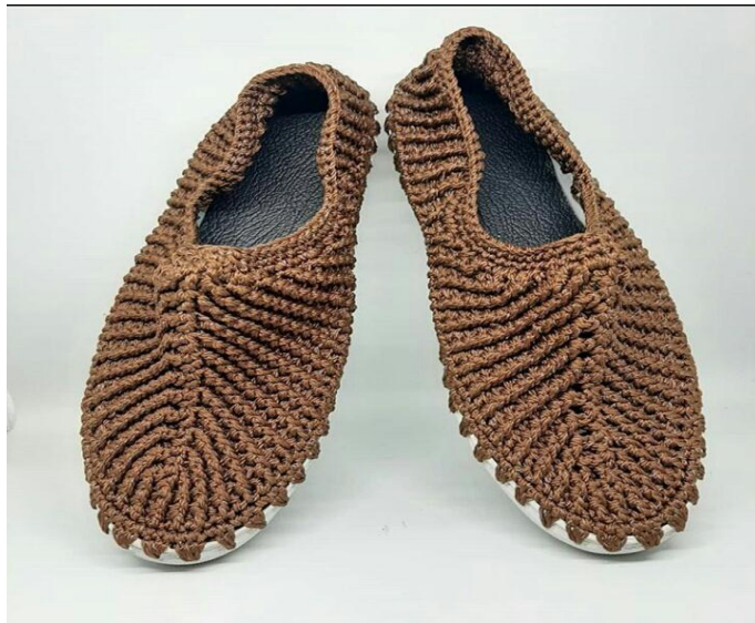
Produk Perempuan Binaan (Merajut) : Sepatu