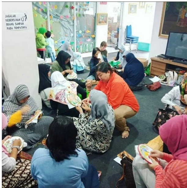
Pelatihan sulam Pita