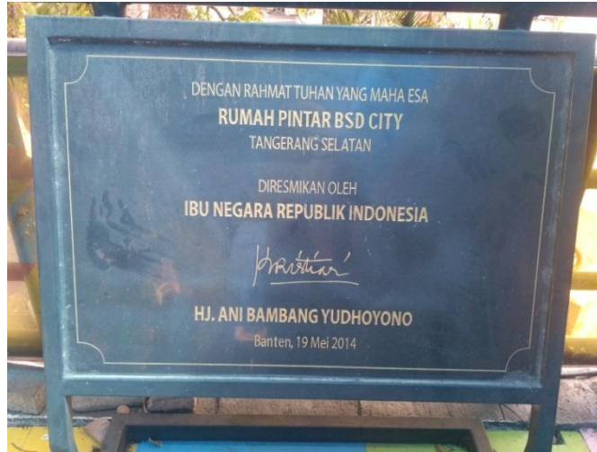
Rumah Pintar BSD