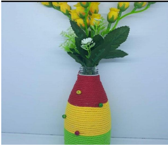
Produk Perempuan Binaan : Hias Botol Menjadi Vas Bunga