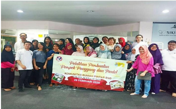
Pelatihan Membuat Mpek-Mpek Panggang