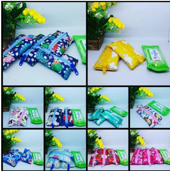
Produk Hasil Perempuan Binaan : Membuat Tempat Tisu