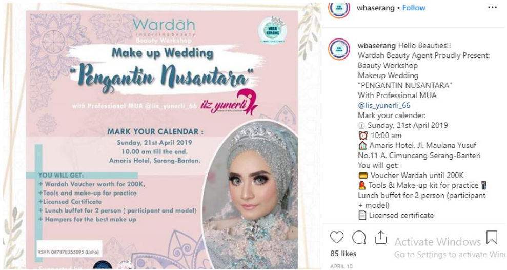
g. Event Beauty Class Bersama MUA dan Instansi Negeri maupun Swasta