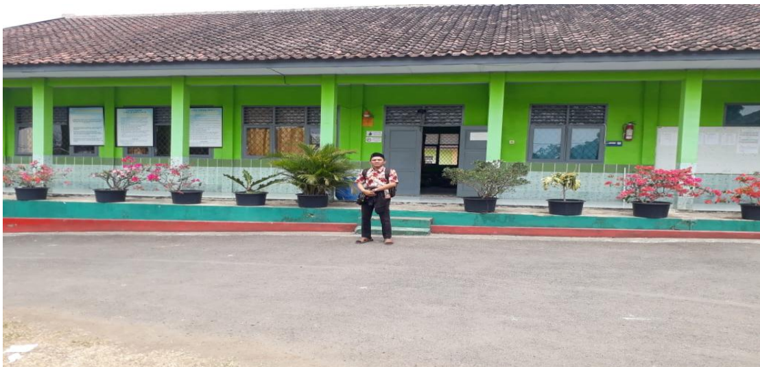
Gambar II Gedung SKh Negri 01 Pembinaan Pandeglang (Gambar Diambil Dari Depan)