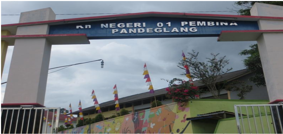
Gambar I Pintu Gerbang SKh Negri 01 Pembinaan Pandeglang (Gambar Diambil Dari Depan)