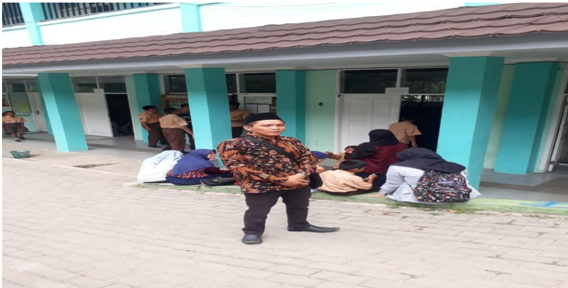
Gambar VIII Foto Gedung Belajar SKh Negeri 01 Kota Serang (Gambar Diambil Dari Depan)