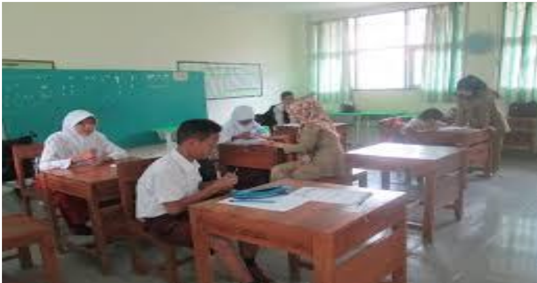
Gambar XI Foto Proses Belajar Di SKh Negeri 01 Kota Serang