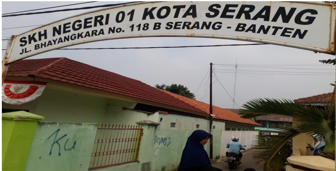
Gambar VII Pintu Gerbang SKh Negeri 01 Kota Serang (Gambar Diambil Dari Depan)