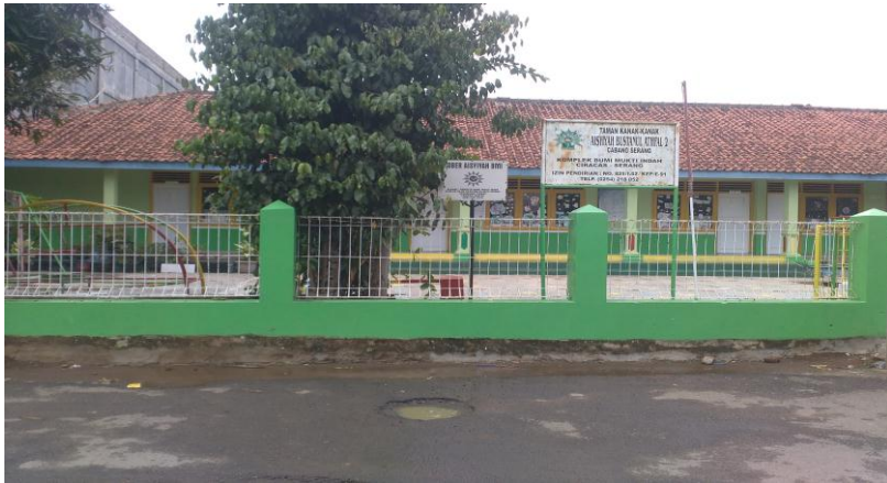
Dok Pribadi, Foto TK Bustanul Athfal 2. Ciracas-Serang 13 November 2018. Pukul 14.03 WIB