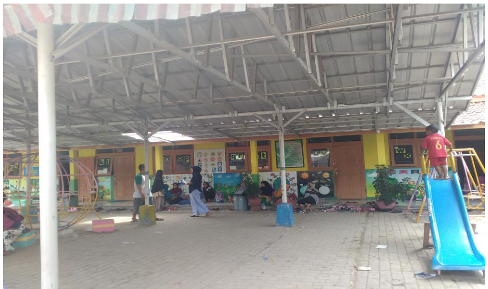
Dok Pribadi, Foto TK Bustanul Athfal. Pontang-Tirtayasa .12 November 2018. Pukul 10.27 WIB