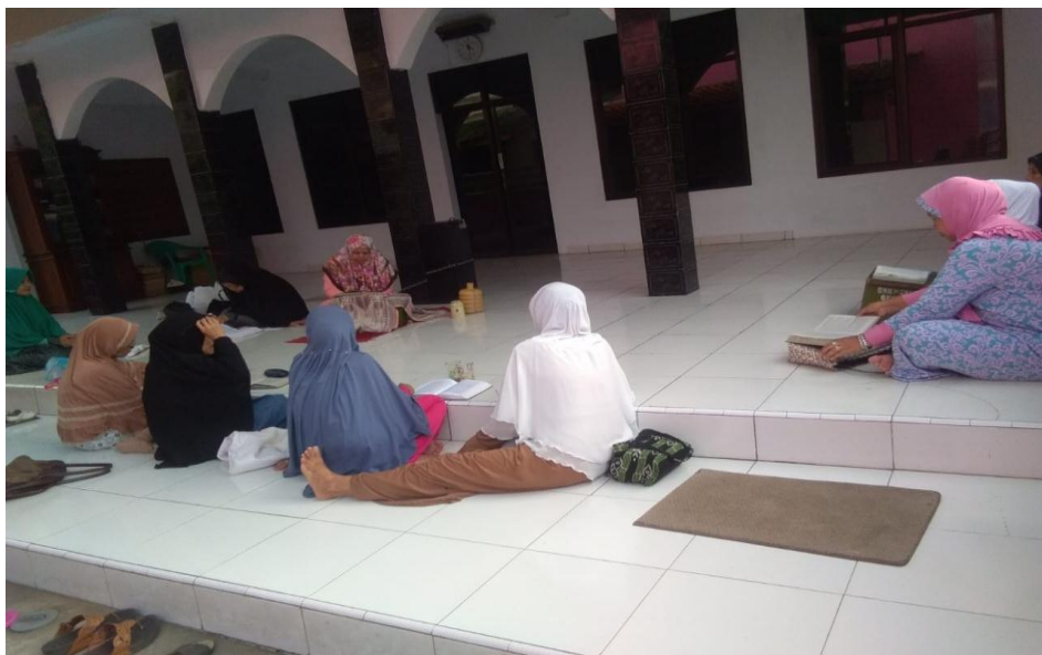
Foto Ketika Mengikuti Pengajian di Mushola Baitul Ghofur. Kaujon, 22 juli 2018 pukul 16.00 WIB