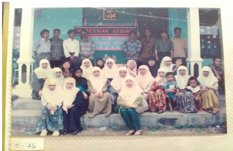
Foto Aktivis Pendiri TK Bustanul Athfal 2. Ciracas-Serang 13 November 2018. Pukul 14.03 WIB