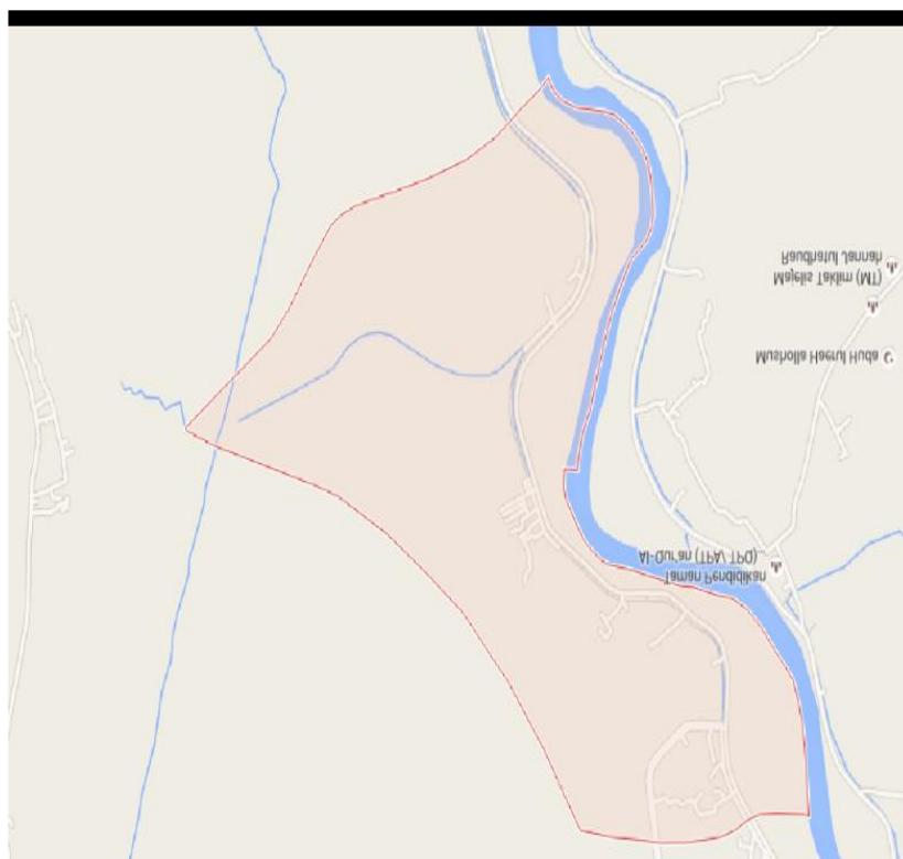
Peta Desa Purwadadi Kecamatan Lebak Wangi