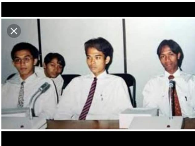
Gambar.3 UAS Saat Kuliah di Al-Azhar Kairo mesir

Pada tahun 1998, ketika Pemerintah Mesir membuka beasiswa untuk 100 orang Indonesia belajar di Universitas Al-Azhar ia pun mengikuti tes dan merupakan salah satu dari 100 orang yang berhak menerima beasiswa, mengalahkan 900-an orang lainnya yang mengikuti tes untuk mendapatkan beasiswa tersebut. Kemudian ia akhirnya memilih untuk