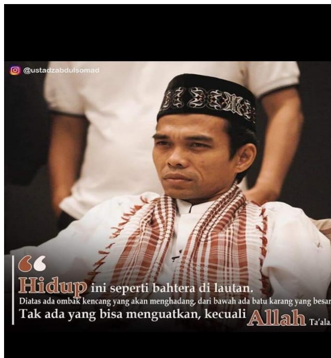
Gambar.1 Ustadz Abdul Somad

Berikut ini Biografi Lengkap Ustadz Abdul Somad :