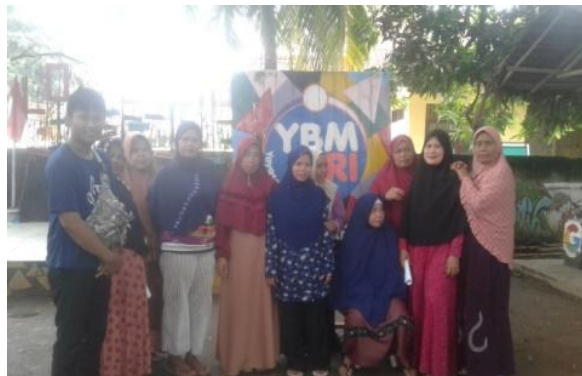
Wawancara bersama anggota program IP2BK dan foto bersama