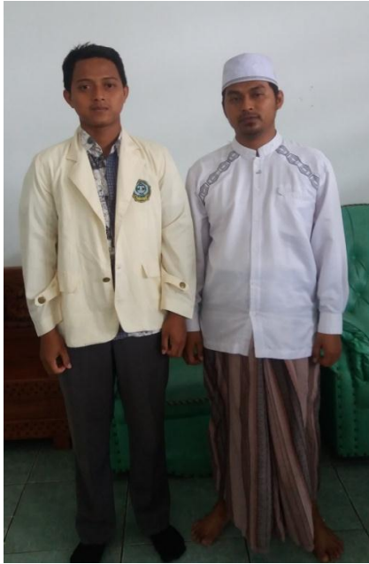
Foto bersama Narasumber