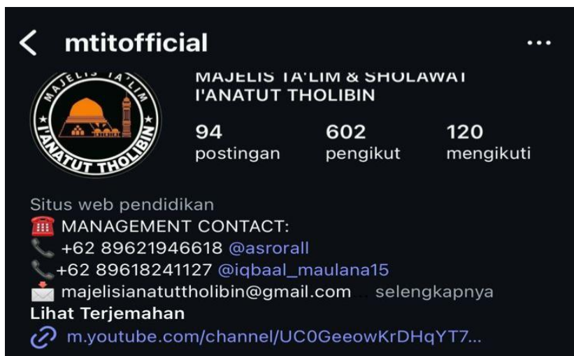
Gambar 1.2 Profil Instagram Majelis Ta'lim dan Sholawat I'natut Tholibin

Melalui kegiatan majelis ta'lim pembacaan sholawat dan pembelajaran Al-Qur'an yang rutin dilakukan. Menyempurnakan kebutuhan Masyarakat modern dan menyelaraskan perkembangan zaman yang membuktikan bahwa majelis ini bukan hanya sekedar Lembaga keagamaan biasa, melainkan agen dakwah yang aktif dan progresif. Kemudian keterlibatan generasi muda menjadi alasan penting mengapa majelis ini dipilih sebagai objek penelitian, karena generasi muda merupakan kelompok yang intens berinteraksi dengan teknologi digital dan media sosial. Di tengah derasnya perkembangan informasi dan konten yang tidak selalu edukatif, peran dakwah menjadi semakin penting untuk memberikan arah, nilai, serta panduan moral. I'natut Tholibin memilih untuk "mendatangi" generasi muda melalui platform yang mereka gunakan, seperti TikTok, Instagram, dan YouTube. Ini menunjukkan adanya kesadaran strategis untuk melakukan dakwah berbasis digital agar lebih relevan dan mudah diterima oleh kelompok usia tersebut.