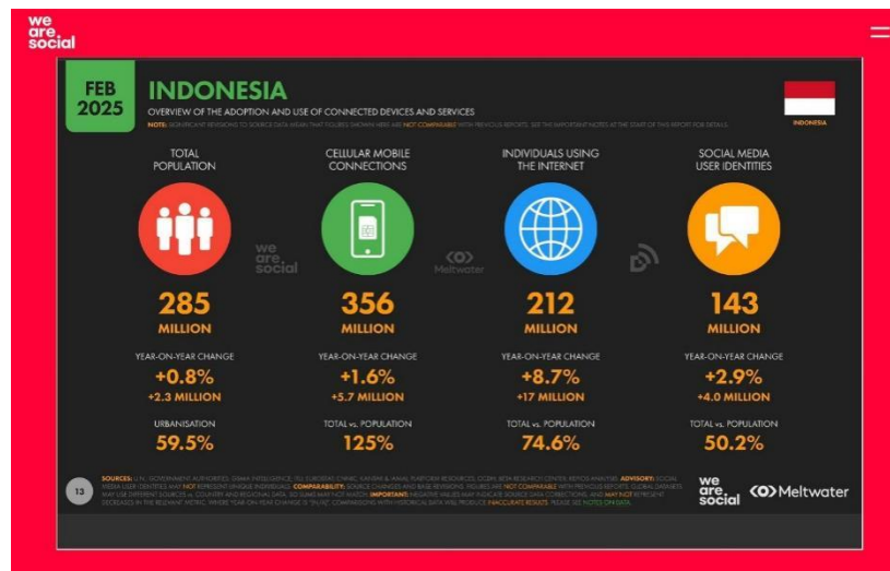
Gambar 1.1 Survey pengguna internet di Indonesia

meningkat 2,9% dari tahun sebelumnya, dengan tambahan 4 juta pengguna baru. 5