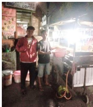
Dokumentasi Bersama Anggota PPKA