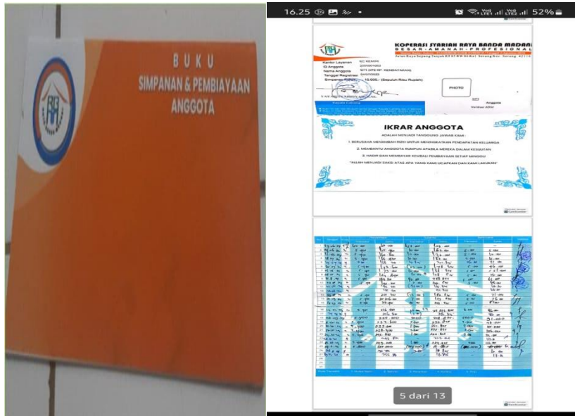
Gambar Ke-11. Buku Simpanan dan Pembiayaan Anggota Koperasi Syariah Rabani