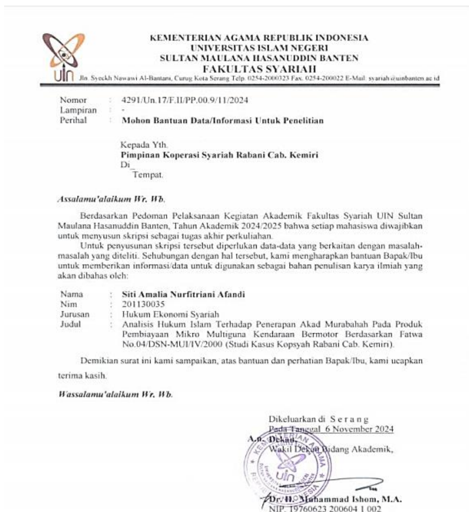
Gambar ke-1. Surat Penelitian