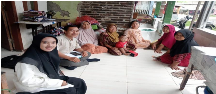
Gambar Ke-6. Observasi dengan para anggota Koperasi Syariah Rabani Cabang Kemiri Kelompok Lontar, pada tanggal 14 Januari 2025.