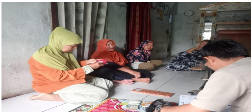
Gambar Ke-7. Observasi dan Wawancara anggota Kelompok Cirumpak, pada tanggal 14 Januari 2025