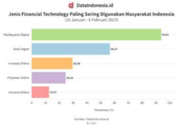
Gambar 1.1 Diagram Profil Fintech Indonesia

Word Economic Forum , Fintech merupakan pemanfaatan teknologi dan bisnis yang inovatif dalam sektor keuangan. 5