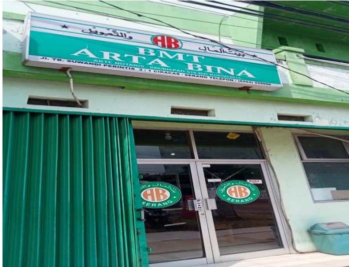
(Lokasi Penelitian : BMT Arta Bina Kota Serang)