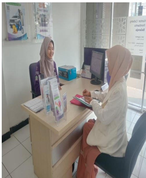
Gambar 6 dan 7

Wawancara penulis dengan Customer Service Bank Muamalat KCP Balaraja di Kantornya, pada tanggal 18 September 2024