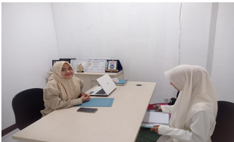
Gambar 4 dan 5

Wawancara Penulis dengan Branch Manager Bank Muamalat KCP Balaraja di Kantornya pada tanggal 05 September 2024