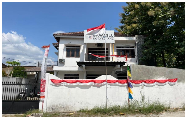
Kantor Bawaslu Kota Serang