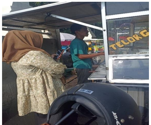
Wawancara dengan Pedagang Kaki Lima di Stadion Maulana Yusuf.