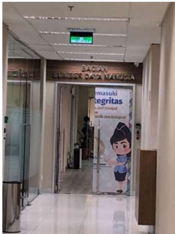
Kantor Direktorat Jenderal Imigrasi Republik Indonesia, Jakarta Selatan.