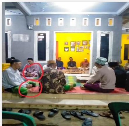
Tasbih yang digunakan dalam ‘‘Ataqah