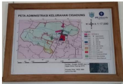
Wilayah Kelurahan Cigadung Gambar 2.