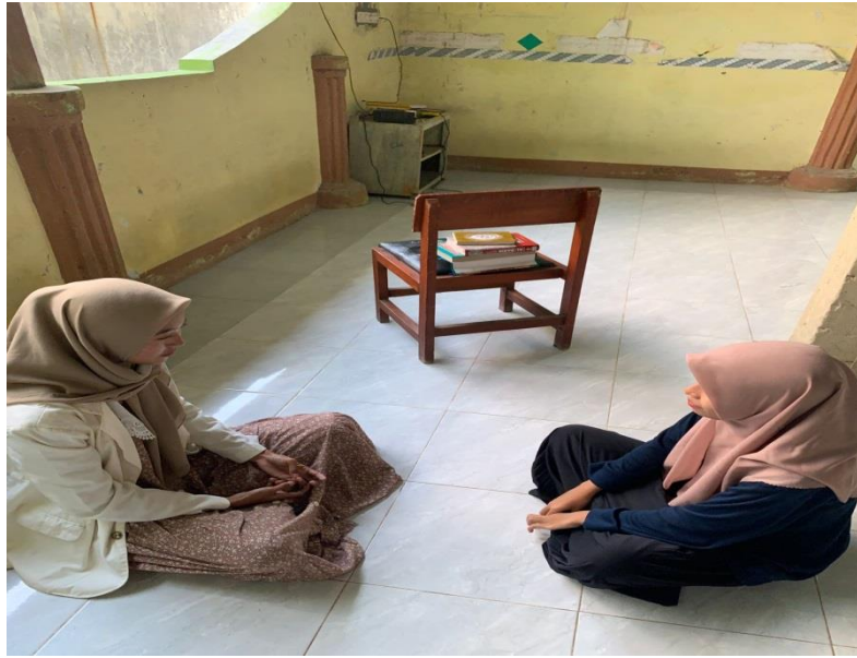
Wawancara Bersama Responden Pendukung