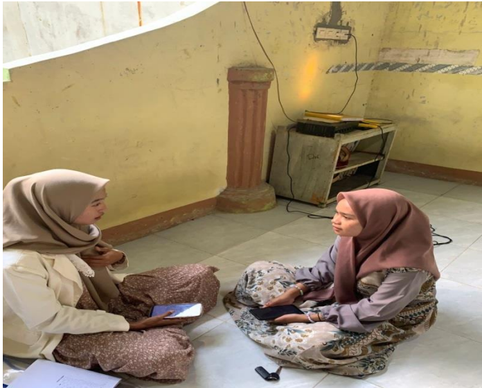
Wawancara Bersama Responden Pendukung