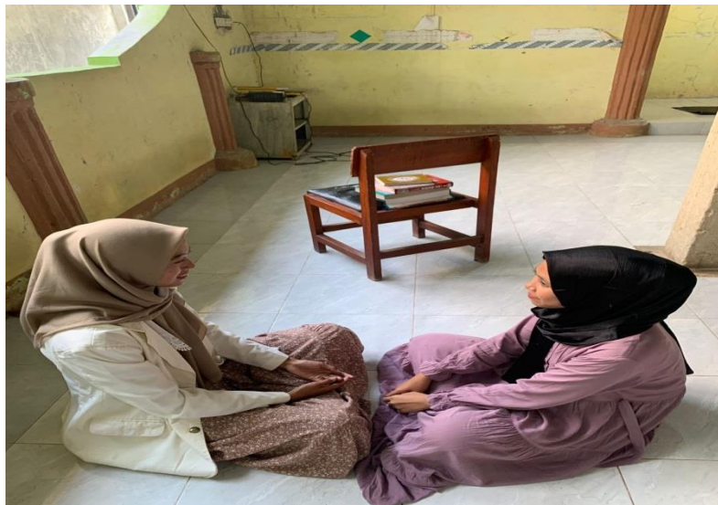
Wawancara Bersama Responden Pendukung