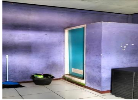
Gambar 2. Kamar Mandi Kos