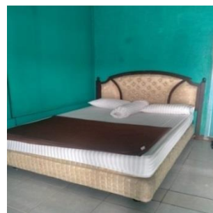
Gambar II.4 Kasur Penginapan