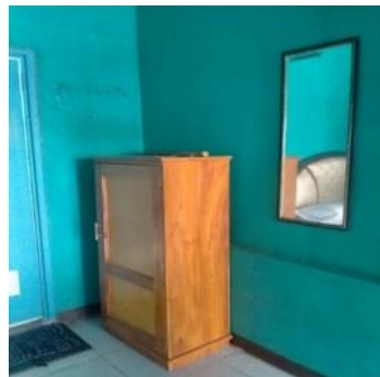
Gambar 5. Layanan Ruangan Sabun Mandi dan Pasta Gigi, Sikat Gigi, Air Mineral, Pendingin Ruangan, Sajadah, Mukena dan Hanc