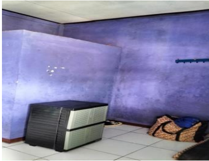
Gambar 1. Ruangan Kamar Kos