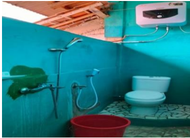
Gambar 6. Kamar Mandi dan Teras Penginapan