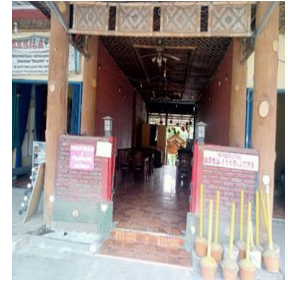
Gambar 7. Restoran