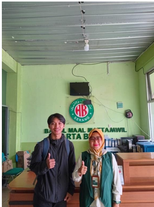
Dokumentasi Kegiatan Wawancara dengan Pihak BMT Arta Bina Ciracas Kota Serang