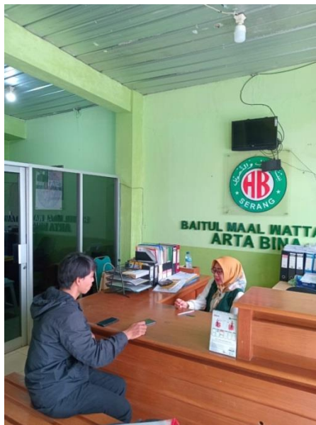
Dokumentasi Kegiatan Wawancara dengan Pihak BMT Arta Bina Ciracas Kota Serang