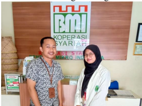
Foto Wawancara bersama Asisten Manajer Administrasi Cabang Ciruas