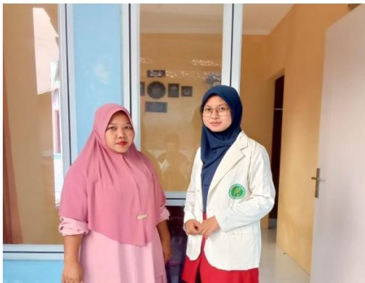
Foto Wawancara Dengan Salah Satu Anggota Kopsyah BMI Yang Mengambil Produk KPR Tanpa DP