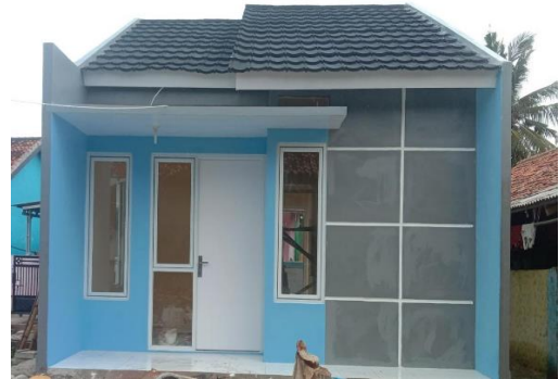
Foto Salah Satu Contoh Rumah Tanpa DP