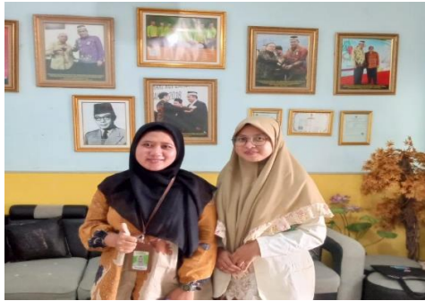
Foto Wawancara bersama Manajer Cabang Pontang