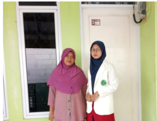
Foto Wawancara Dengan Salah Satu Anggota Kopsyah BMI Yang Mengambil Produk KPR Tanpa DP