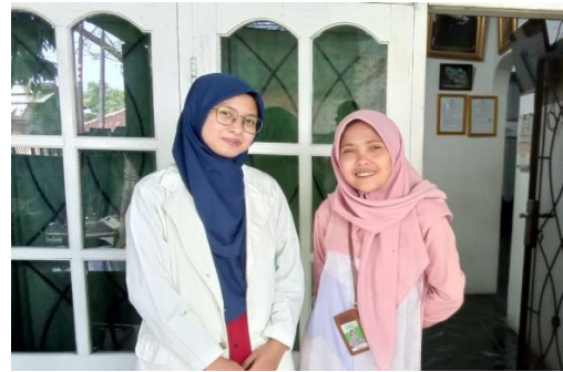
Foto Wawancara bersama Manajer Cabang Tirtayasa