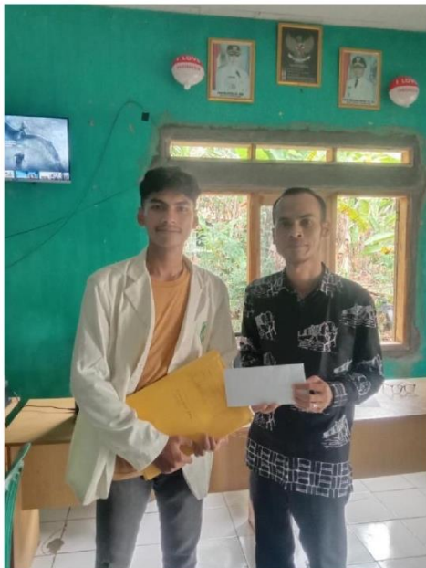
Foto bersama Sekdes dalam rangka Izin Observasi ke Desa Tanagara