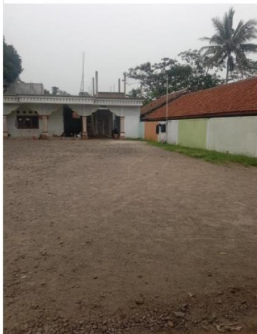
Mushola Objek Wisata Religi