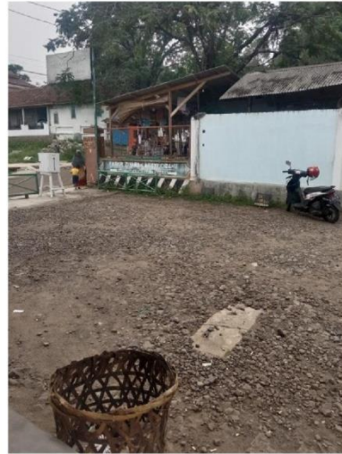
Tempat Parkir Objek Wisata Religi