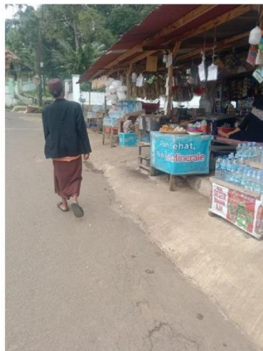
Tempat Perbelanjaan Objek Wisata Religi Makam Abuya Dimiyati