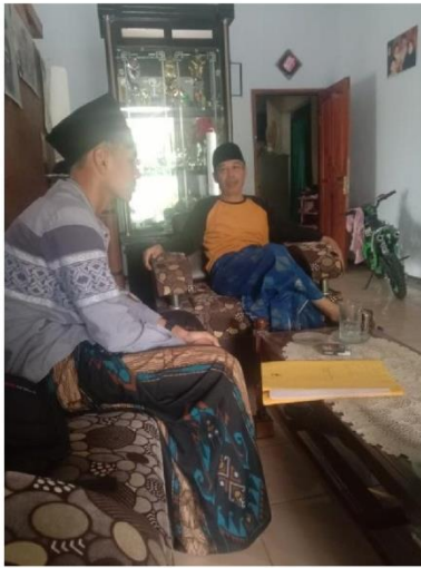
Wawancara dengan tokoh masyarakat Cidahu