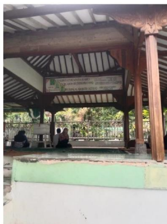
Tampak depan Objek Wisata Religi Makam Abuya Dimiyati Cidahu